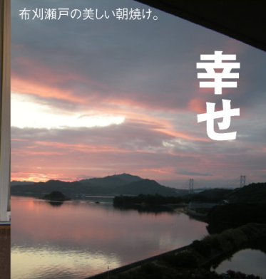
布川瀬戸の美しい朝焼け。