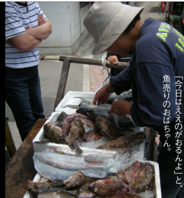
「今日はえんがあるんだよ、魚売りのおばちゃん。」