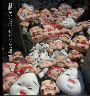
お面がいっぱい、せとうち七福神。