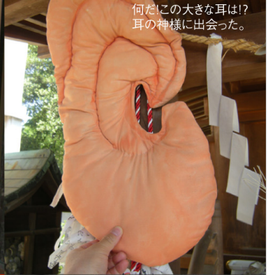
何だ!この大きな耳は!? 耳の神様に会った。