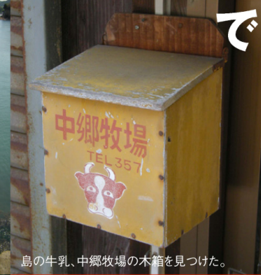
島の牛乳、中郷牧場の木箱を見つけた。