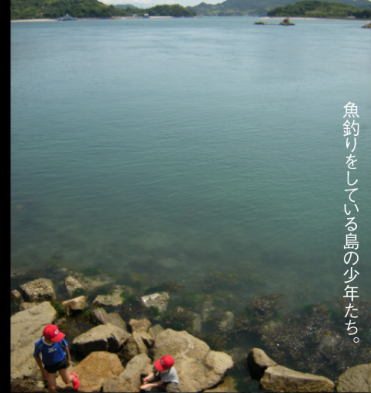
魚釣りをしている島の少年たち。