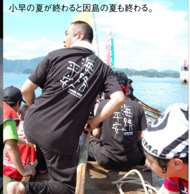
小早の夏が終わると因島の夏も終わる。