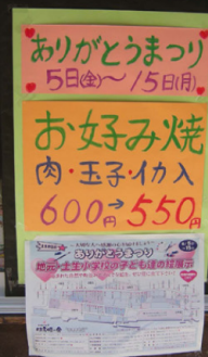
土生にはお好み焼屋さんが多い。なぜかうどん入りが人気だ。