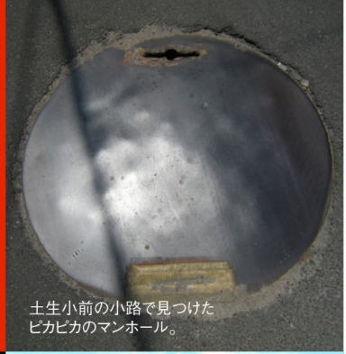
土生小前の小路で見つけたピカピカのマンホール。